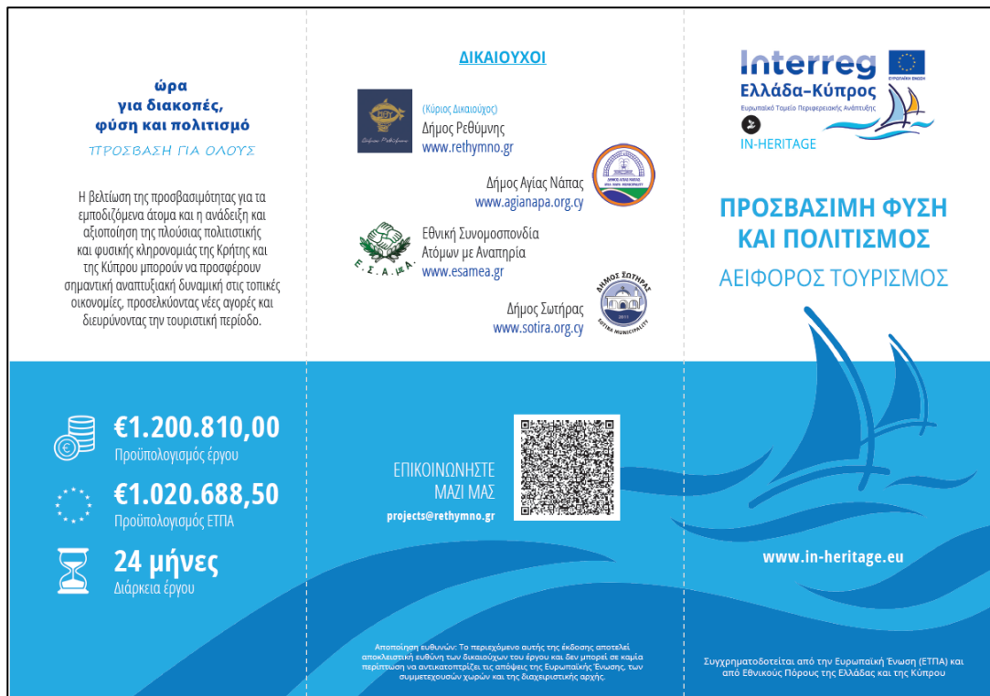
Το εξωτερικό του ενημερωτικού φυλλαδίου (όπως φαίνεται μετά το ξεδίπλωμα)

Το εν λόγω φυλλάδιο, σύμφωνα με της απαιτήσεις της Σύμβασης, παράχθηκε και μια σειρά εναλλακτικών ψηφιακών μορφών προσβάσιμων σε διάφορες κατηγορίες αναπηρίας (ΕΛ-ΕΝ): προσβάσιμο PDF, προσβάσιμο WORD, ηχητική έκδοση MP3 με συνθετική φωνή μέσω τεχνολογίας TTS, έκδοση φιλική για εκτύπωση Braille (PEF) και έκδοση Large Print για αμβλύωπες